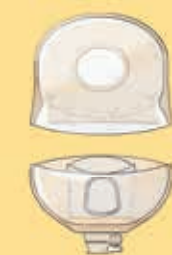
Meerdere compartimenten, voorzijde.

De vernieuwde Conform 2 urostomazakjes hebben meerdere ingebouwde compartimenten, waarin de urine zich gelijkmatig verdeelt. Dit zorgt voor een platter urostomazakje.